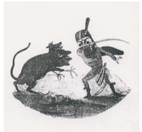
Nussknacker und Mausekönig