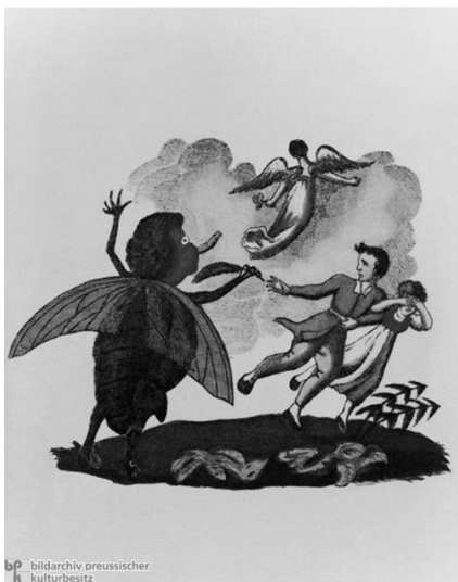
Das fremde Kind