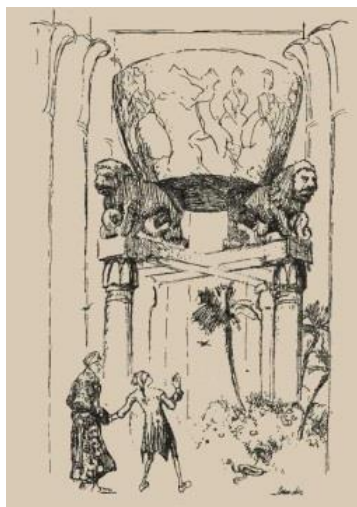
Der Goldne Topf